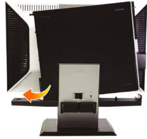
2 Slide the computer onto the stand

將顯示器連接到支架上 將顯示器接上支架 モニターをスタンドに取り付けます モニタをスタンドに 부착합니다 ต่อจอภาพกับขาตั้ง