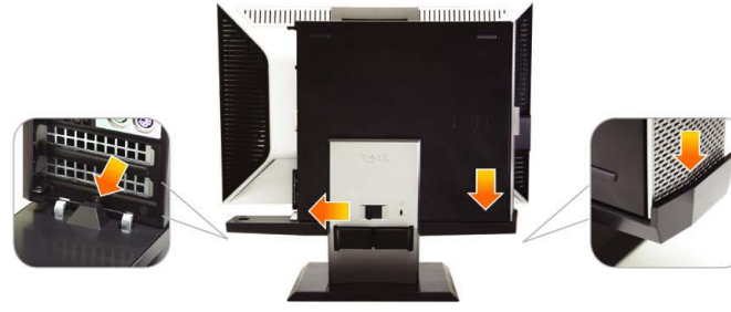
3 Engage the computer to the stand auto locking mechanism

推動計算機，使其滑行至支架上 將電腦推至支架上 コンピュータをスタンドにスライドさせます 컴퓨터를 스탠드에 밀어 넣습니다 เลื่อนคอมพิวเตอร์ เข้าล็อกกับขาตั้ง