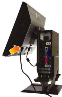
5 Connect the power cable firmly to the monitor as shown

將藍色模擬(VGA)線纜連接到電腦上。 將藍色模擬(VGA)線纜連接到電腦上。 青いVGAケーブルをコンピュータに接続します 청색 VGA 케이블을 컴퓨터에 연결합니다. เชื่อมต่อสายเคเบิล VGA สีน้ำเงินเข้ากับคอมพิวเตอร์