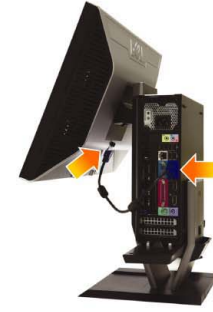
4 Connect the blue VGA cable to the computer

使計算機連接到支架自動鎖定裝置 使電腦連接到支架自動鎖定裝置 コンピュータをスタンドの自動ロック機構にかみあわせます。 컴퓨터를 스탠드 자동 잠금 장치에 고정합니다 ยึดคอมพิวเตอร์เข้ากับกลไกการล็อกอัตโนมัติของขาตั้ง