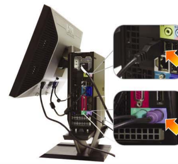
7 Connect the USB, keyboard and mouse cables to the computer as shown

將電源適配器可靠地連接到電腦（如圖所示） 請將變壓器確實連接至電腦（如圖所示） 図のように、電源ケーブルをコンピューターにしっかり挿入する 전원 어댑터를 아래와 같이 컴퓨터에 단단히 연결합니다 เชื่อมต่ออะแดปเตอร์ไฟ กับคอมพิวเตอร์ให้แน่น ตามรูป