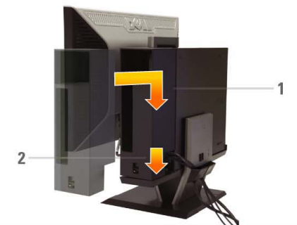
8 Connect the power cables to an outlet. Install the cable cover

將USB、鍵盤和鼠標線連接到電腦（如圖所示） 請將USB、鍵盤以及滑鼠線連接到電腦（如圖所示） 図のように、USB、キーボード、マウスケーブルをコンピューターに接続します USB 케이블, 키보드 케이블, 마우스 케이블을 아래와 같이 컴퓨터에 연결합니다 เชื่อมต่อสาย USB แป้นพิมพ์ และเมาส์ กับคอมพิวเตอร์ ตามรูป