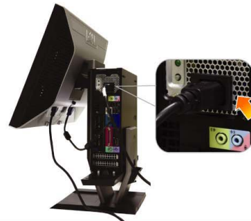
6 Connect the power cable firmly to the computer as shown

將電源線連接到顯示器（如圖所示） 請連接顯示器電源線（如圖所示） 図のように、電源ケーブルをモニターに接続します 전원 케이블을 아래와 같이 모니터에 연결합니다 เชื่อมต่อสายไฟกับจอภาพ ตามรูป